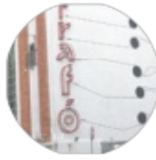
HÚSZ ÉVE DÜBÖRÖG A KORTÁRS TRANSZFORMÁTOR