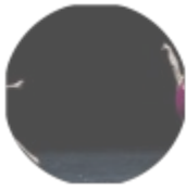
FESZTIVÁLLAL NYIT AZ ÚJ TÁNCSZÍNHÁZ