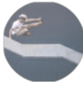
BÁRMELYIK PILLANATBAN KAPHATSZ EGY TELEFON